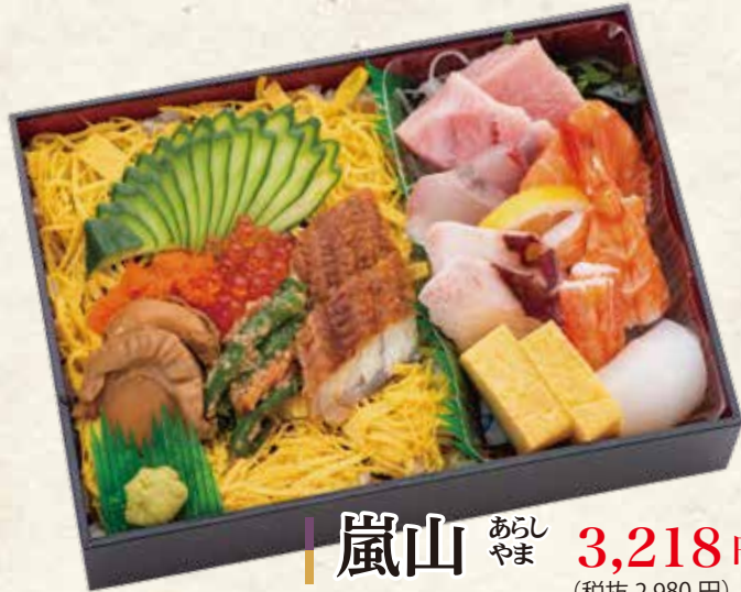
嵐山 あらしやま 3,218円 (税抜 2,980円) 151×211×42mm [二合折]