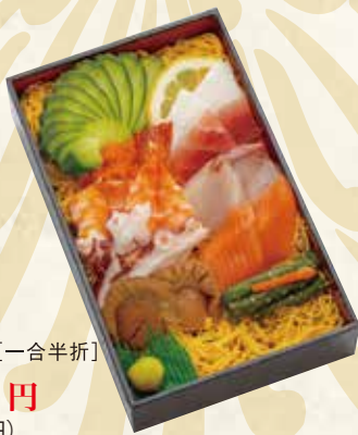
八坂 やさか 1,706円 (税抜 1,580円) 198×122×33mm [一合半折]