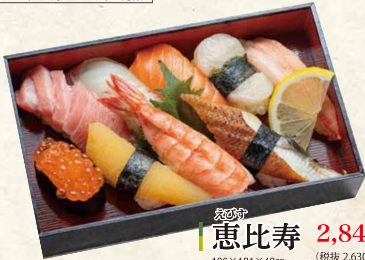
恵比寿 2,840円 (税抜 2,630円) 196×121×42mm [一合半折]