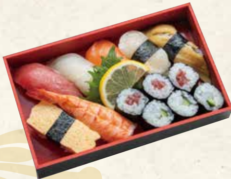
神楽 かぐら 2,106円 (税抜 1,950円) 198×122×33mm [一合半折]