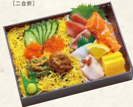
祇園 ぎおん 2,106円 (税抜 1,950円) 151×211×42mm [二合折]