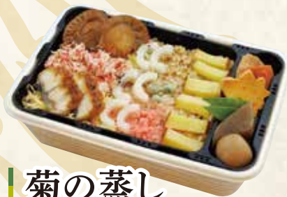
菊の蒸し 1,706円 (税抜 1,580円) 145×212×58mm なるほっとで いつでもどこでも あたたかい