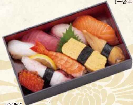
築地 つきじ 2,268円 (税抜 2,100円) 196×121×42mm [一合半折]