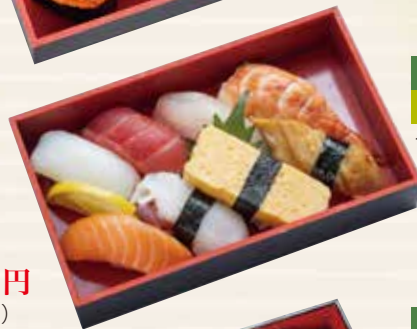
桜 まぐろ赤身 白身魚入り 122×198×33mm 1,800円 (税込 1,944円)