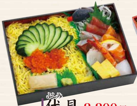
ふしみ 伏見 2,200円 151×211×42mm (税込 2,376円) [二合折]