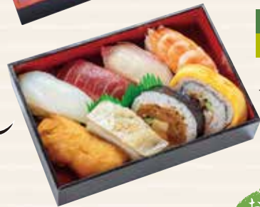
いろは 大阪寿しとにぎり寿し 115×170×33mm 1,500円 (税込 1,620円)