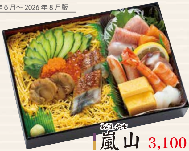
あらしやま 嵐山 3,100円 151×211×42mm (税込 3,348円) [二合折]