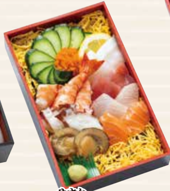
やさか 八坂 1,800円 198×122×33mm (税込 1,944円) [一合半折]