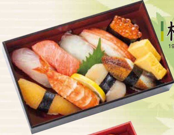
梅 豊洲直送 本まぐろ大とろ 高知県産うなぎ 196×121×42mm 3,300円 (税込 3,564円)