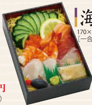
海鮮ちらし 170×115×33mm (税込 1,620円) [一合折]