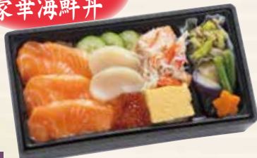
海鮮づくし 1,500円 200×110×45mm (税込 1,620円) [一合折]