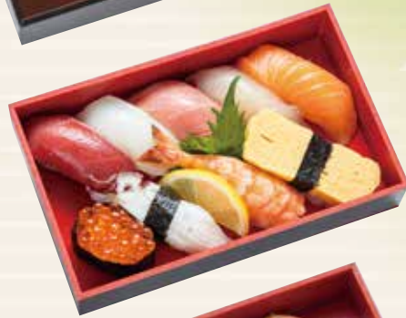
竹 豊洲直送 本まぐろ中とろ いくら入り 122×198×33mm 2,500円 (税込 2,700円)