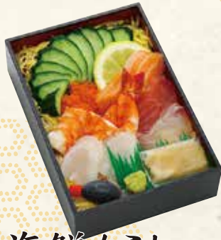
海鮮ちらし 170×115×33mm [一合折] 1,380円 (税抜 1,278円)