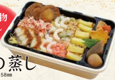
菊の蒸し 145×212×58mm 1,750円 (税抜 1,620円)