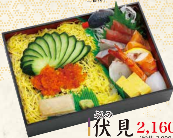
ふしみ 伏見 2,160円 151×211×42mm (税抜 2,000円) [二合折]