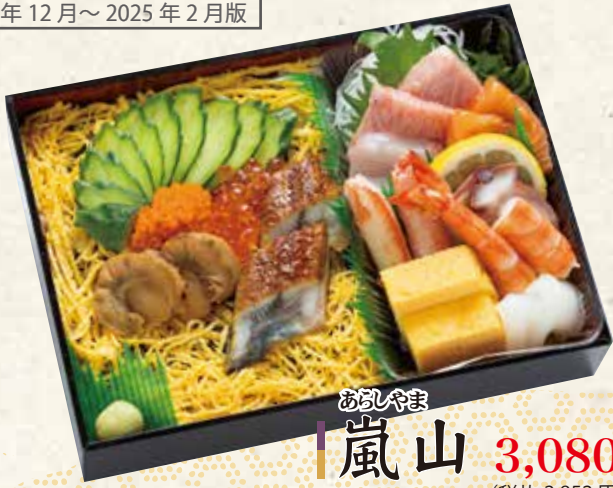
あしやま 嵐山 3,080円 151×211×42mm (税抜 2,852円) [二合折]