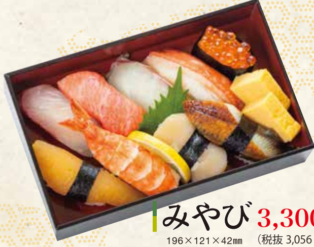
みやび 3,300円 196×121×42mm (税抜 3,056円)