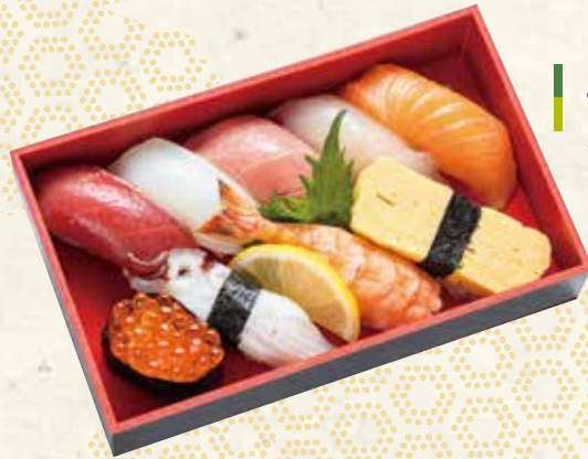
うたげ 122×198×33mm 2,300円 (税抜 2,130円)