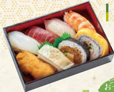
いろは 115×170×33mm 1,500円 (税抜 1,389円)