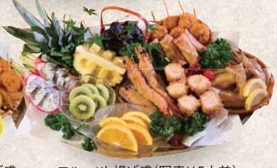
フルーツと揚げ盛(写真は5人前)