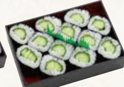
きゅうり巻 1人前(2本) 920円(税込994円)