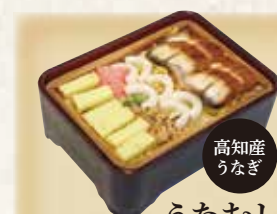
高知産うなぎ うなむし 1,150円(税込1,242円)