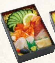
海鮮ちらし 1,150円(税込1,242円)