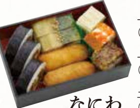
一折 1,150円(税込1,242円) 一折 1,480円(税込1,598円) 二折 2,230円(税込2,408円)