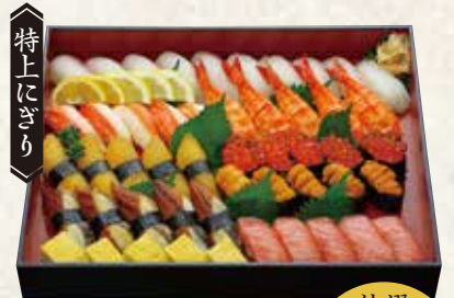
特撰 みやび 大トロ・うに入り 3人前/27貫 9,000円(税込9,720円) 5人前/45貫 15,000円(税込16,200円)