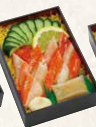
かにちらし 1,250円(税込1,350円)