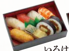
いろは 一折 1,150円(税込1,242円)