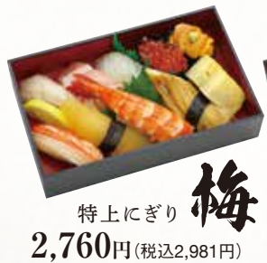
特上にぎり 梅 2,760円(税込2,981円)