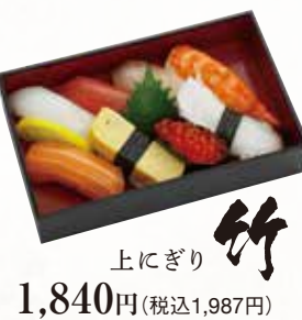
上にぎり 竹 1,840円(税込1,987円)