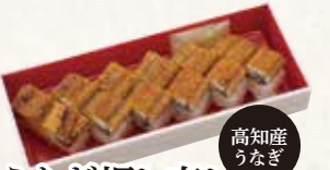
高知産うなぎ うなぎ押し寿し 1,560円(税込1,685円)