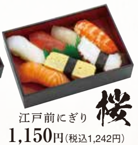
江戸前にぎり 桜 1,150円(税込1,242円)