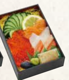
北海ちらし 1,250円(税込1,350円)