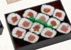
鉄火巻 1人前(2本) 1,260円(税込1,361円)