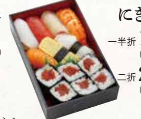
にぎり鉄火 一折 1,700円(税込1,836円) 二折 2,180円(税込2,354円)