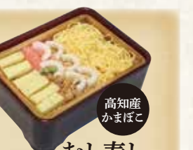
高知産かまぼこ むし寿し 830円(税込896円)

レンジで温める 冷凍むし寿し 東京銀座「まるごと高知」でも好評販売中! 全国・高知市外へ宅急便でお届けします