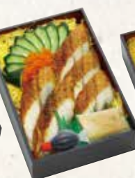
うなちらし 1,480円(税込1,598円)