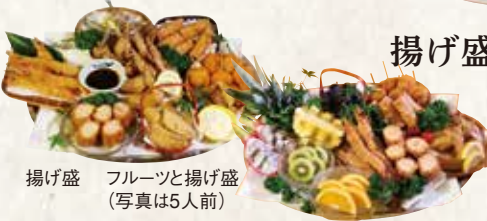
揚げ盛 フルーツと揚げ盛 (写真は5人前)