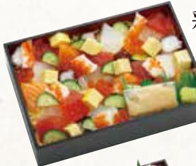
彩りちらし 1,380円(税込1,490円)