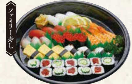
だんらん 3~4人前 5,000円(税込5,400円) 5~6人前 8,000円(税込8,640円)