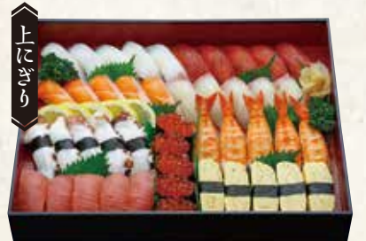
特撰 つどい 中トロ入り 3人前/27貫 6,000円(税込6,480円) 5人前/45貫 10,000円(税込10,800円)