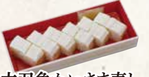
太刀魚かいさま寿し 870円(税込940円)