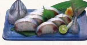
※さばの大きさが価格が変動します。