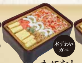
本すわいガニ かにむし 1,150円(税込1,242円)