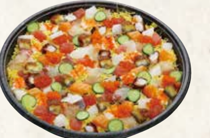
ばらちらし 3~4人前 5,000円(税込5,400円)