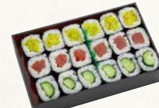
三色巻 1.5人前(3本) 1,550円(税込1,674円)