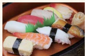
にぎり一人前 桜 1,000円