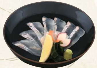
ひらめ 刺身 1,300円