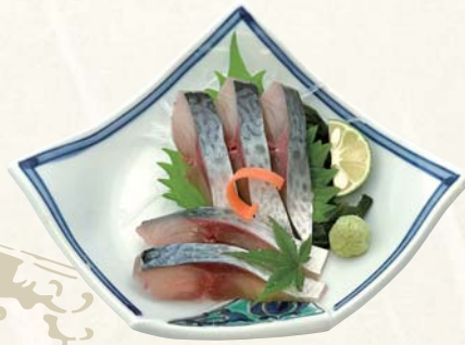
清水サバ 刺身 1,200円