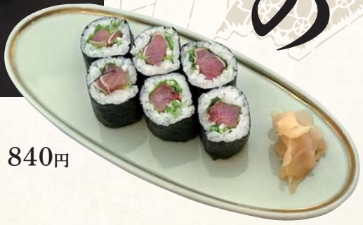
【元祖】 土佐巻 840円