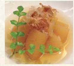
数の子 付だし 750円