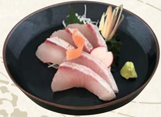
カンパチ 刺身 1,200円