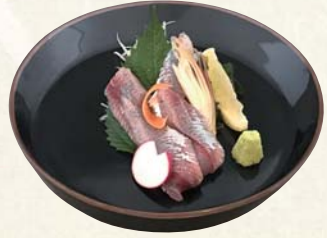
うるめイワシ 刺身 600円