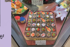
↑ 大丸外観とお土産 高知には無いお店やいろいろな 商品がたくさんありすぎて おみやげが大変でした