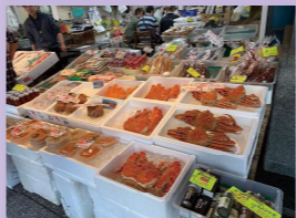
札幌の二条市場 北海道ならではの新鮮な魚介類が たくさんあり店頭でも食事ができ 大満足!