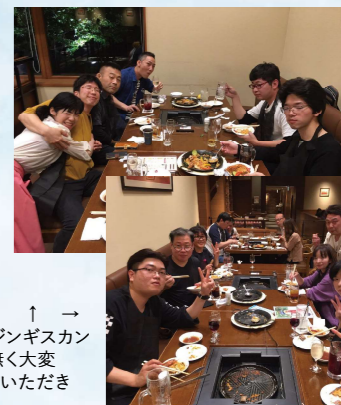
↑ 本場のジンギスカン 臭みも無く大変 美味しかったです

高知空港を出て羽田経由で新千歳空港です。あっという間に北海道につきました。 空港から貸し切りバスに乗り換えて一路富良野へ。富田ファームの広大なお花畑で深呼吸をしてチーズ工房を見学。 それから宿泊予定の札幌入りをしホテルまでの道すがら、時計台・テレビ塔・大通り公園をバス観光。 晩御飯はサッポロビール園にて大いに盛り上がり、食事の後各自で札幌の繁華街を楽しみました。