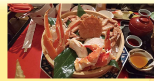
かなり大きいサイズながら→ 肉厚で身が多く、大満足の一品!