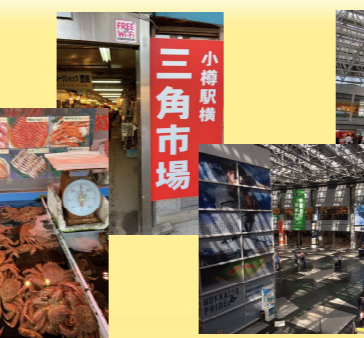
空港もびっくりするくらい 広く、北海道ならではの 飲食店も多く 最後の北海道を 満喫しました 想像以上の広さに驚き!