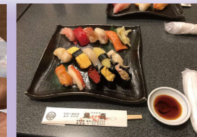
← 魚真(うおまさ)寿司 北海道ならではの 北寄貝・ボタン海老・ ウニ・イクラ・カニ・ サーモン・ホタテなど が入ってとても 美味しかったです!

朝早く二条市場へ行き朝食を食べ北海道の食材を満喫。札幌駅前の街を歩いて 観光しながら大丸と東急(デバ地下)など見学。大丸、東急の大きさビックリ!その後小樽のホテルまで バスで移動。チェックイン後は自由行動でそれぞれでガラス工場や小樽の観光を楽しみました。夕食は全員揃って魚真寿司(うおまさずし)さんにて 美味しいお寿司を楽しみました。魚真さんが仲卸をやっているという事で、ネタも新鮮でおいしく、その上とてもリーズナブルに小樽の海鮮を堪能さ せていただきました。その後は夜風に当たりながら小樽運河まで歩きクルーズを満喫しました。