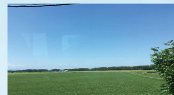
↑ 富良野の広大な 土地 スケールが 違いました 前見ても後ろ 見ても見渡す限り の花畑 とっても 綺麗でした