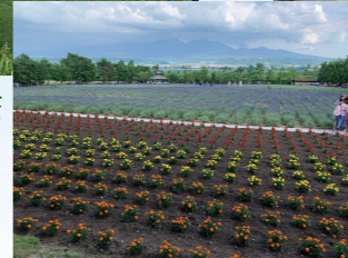
↑ 富良野の広大な 土地 スケールが 違いました 前見ても後ろ 見ても見渡す限り の花畑 とっても 綺麗でした