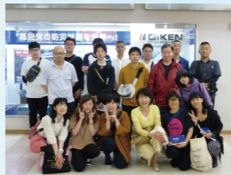
出発前に全員集合、期待に胸を膨らませ いざ出発進行!!